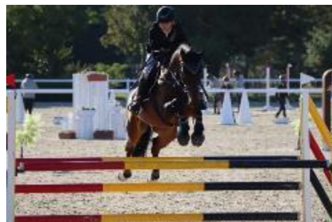
坂藤とココドロ号

馬場 最終得点率 66.1% 減点 33.9 クロスカントリー 総減点 0 タイム 4.38 障害 総減点 0 タイム 64.9 総減点 33.9