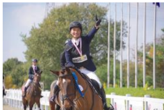
吉田とアルボア号のウィニングラン