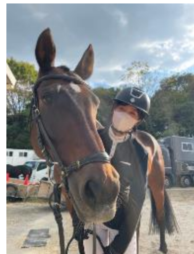
坂藤とココドロ号