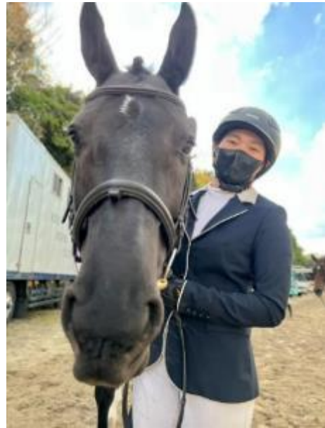
鶴見とエオウィン号

皆様のご期待にお答えできますよう、部員一同真摯に活動してまいりますので、今後ともご支援賜りますようお願い申し上げます。